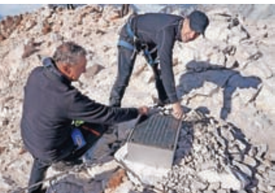
Oktober lani so strokovnjaki ZVKD Slovenije montirali spominsko ploščo na nov podstavek ...

Sedmega septembra 2018 so v dolino pripeljali Aljažev stolp, kjer so ga obnovili in ga zatem namestili nazaj na vrh Triglavu. Na Aljažev stolp je bila pred njegovo obnovo pritrjena spominska plošča z napisom: Na tem mestu so med NOB l. 1944 partizani; Gradnikove brigade, kulturniki IX. korpusa, jeseniško - bohinjskega odreda in mladinci OK. Bohinj podrli mejnik Italija - Nemčija in izobesili slovensko zastavo.