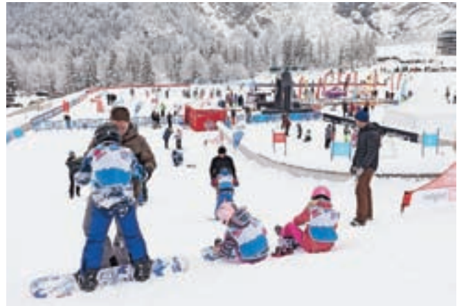
Takole je bilo lani na Svetovnem dnevu snega v Planici.