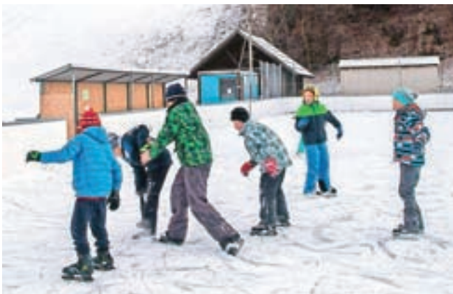
Drsanje pred nekaj dnevi v Mojstrani

Na smučišču Kranjska Gora in v Podkorenu je minule dni obratovalo od 7 od 17 naprav, nočna smuka je bila možna na sedežnici Kekec. Več informacij o dnevnem obratovanju naprav dobite na telefonski številki 04 5809 400.