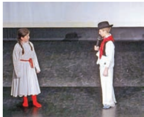
Učenci so se podali na pot po slovenskih pokrajinah.