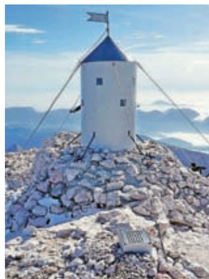
v neposredno bližino Aljaževega stolpa na Triglavu.