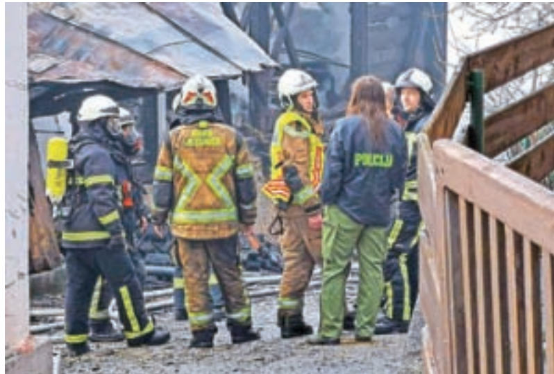
Velikemu požaru na Dovjem so se zoperstavili 104 gasilci z 21 vozili.

»Saj se čudno sliši, a se je intervencija še kar dobro končala. Res so nam pogoreli trije objekti in četrti delno, a pred ognjem nam je uspelo obvarovati dve najbližji hiši, ki sta bili že zelo ogroženi. Kakor je kazalo na začetku, je obstajala nevarnost, da bi lahko gorelo tudi pol vasi, saj je Dovje zelo strnjeno naselje,« je še povedal Orejaš.