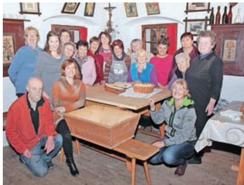
Z zadnje delavnice v Liznjekovi domačiji

Razvojna agencija Zgornje Gorenjske je s financiranjem Občine Kranjska Gora izvedla osem medgeneracijskih kuharskih delavnic pod imenom Domače jedi Doline. Brezplačne delavnice so potekale od oktobra do decembra 2019 na različnih lokacijah: v Hotelu Rute v Gozdu - Martuljku, v Krajevni skupnosti Rateče - Planica in v soorganizaciji z Gornjesavskim muzejem Jesenice tudi v Liznjekovi domačiji v Kranjski Gori. Tri delavnice so bile organizirane v šolah – dve v OŠ 16. decembra Mojstrana in ena v OŠ Josipa Vandota Kranjska Gora. Učenci so domače jedi pripravljali v sklopu pouka. »Udeleženci delavnic, skupaj jih je bilo več kot sto, so se učili priprave različnih jedi, ki so značilne za območje Zgornjesavske doline. Pri kuhi in peki so aktivno sodelovali, pri tem iz-