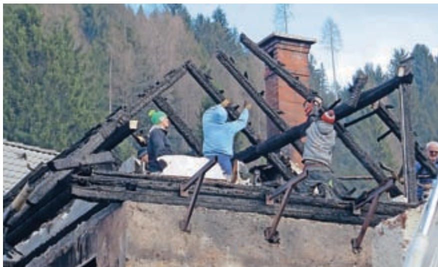
Krajani Dovjega so v soboto zjutraj takoj pristopili k čiščenju pogorišča.

V soboto, dan po požaru, se je v središču Dovjega zbrala domala celotna vas. Rohneli so traktorji in gradbeni stroji, s katerimi so vaščani hiteli odstranjevat ostanke petkovega razdejanja. Ob občinski stavbi pri Katr so postavili mize