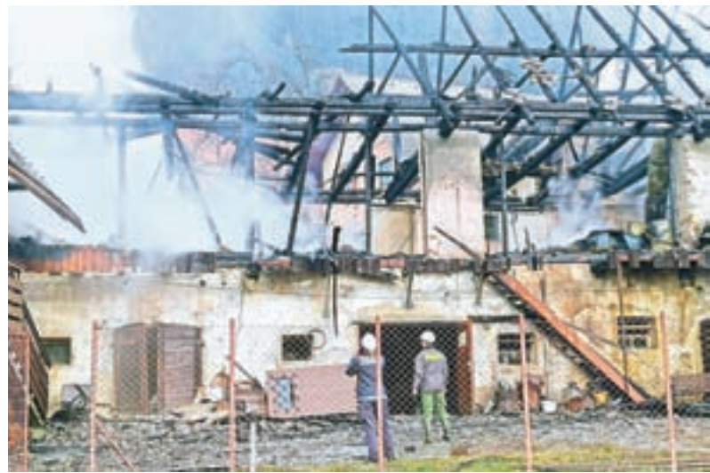
Kriminalisti so ugotovili, da je zagorelo zaradi samovžiga materiala v leseni lopi.

Gorenjski kriminalisti so ugotovili, da je zagorelo zaradi samovžiga materiala v leseni lopi. "Ogenj se je zaradi majhnega odmika od sosednjih objektov od tam najprej razširil na eno in potem še na drugo gospodarsko poslopje ter na dve stanovanjski hiši. V požaru so bili huje poškodovani trije objekti. Nastala je velika materialna škoda. Z ugotovitvami bodo kriminalisti seznanili pristojno državno tožilstvo," je sporočil Bojan Kos s Policijske uprave Kranj.