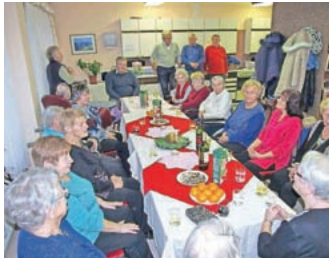
V družbi kranjskogorskih občanov, ki prebivajo v Domu upokojencev dr. Franceta Bergelja na Jesenicah