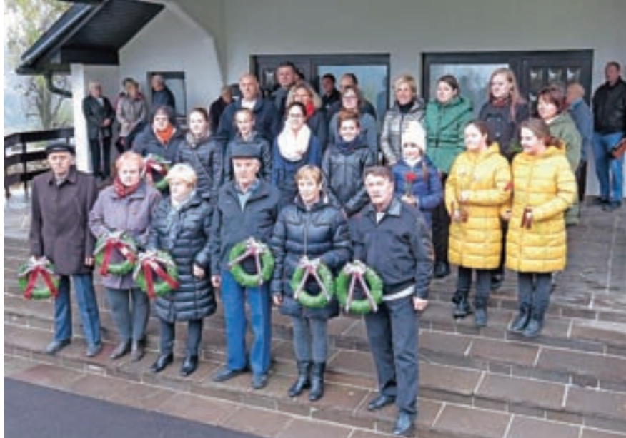
Z venčki in kulturnim programom so se poklonili vsem, ki so dali življenja za domovino.