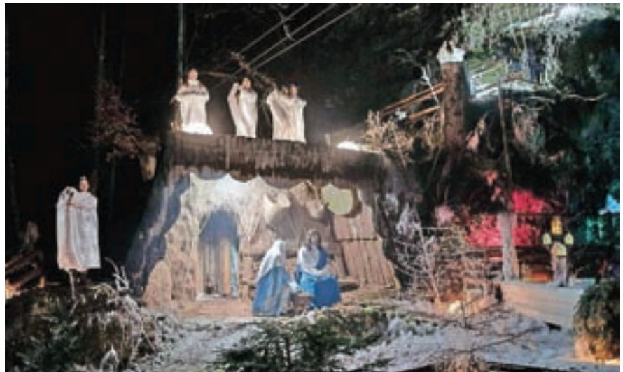
Organizatorjem in nastopajočim gre tudi letos čestitati za odlično izvedbo Živih jaslic.

"Ustvarjalcu ledenega kraljestva Pavlu Skumavcu so temperature predstavljale neizmeren izziv in zares je čudež, da mu je uspelo ne samo ustvariti ledeno deželo, ampak jo celo vsak dan nadgrajevati. Občudovanja vredna je njegova vztrajnost, ko je moral v decembru kar sedemkrat začeti od začetka," je poudarila Cotmanova. V ledeno kraljestvo v sotesko Mlačca v Mojstrano tudi v januarju (odpiralni čas bodo prilagajali vremenskim pogojem) vabijo vse, ki si želijo doživeti lepoto minljive ledene umetnosti. Obiskovalci se od ledenih zaves, brvi, vodometov, brzic, polarnih živali ... sprehodijo mimo prizorišča Živih jaslic do šestnajstih izzivov. "Igre, ki smo jih pripravili, so igrive, spretnostne, miselne; nekatere spodbujajo vztrajnost, druge iskrenost, in vidimo, da so v veselje prav vsem generacijam," je še povabila Nataša Cotman.