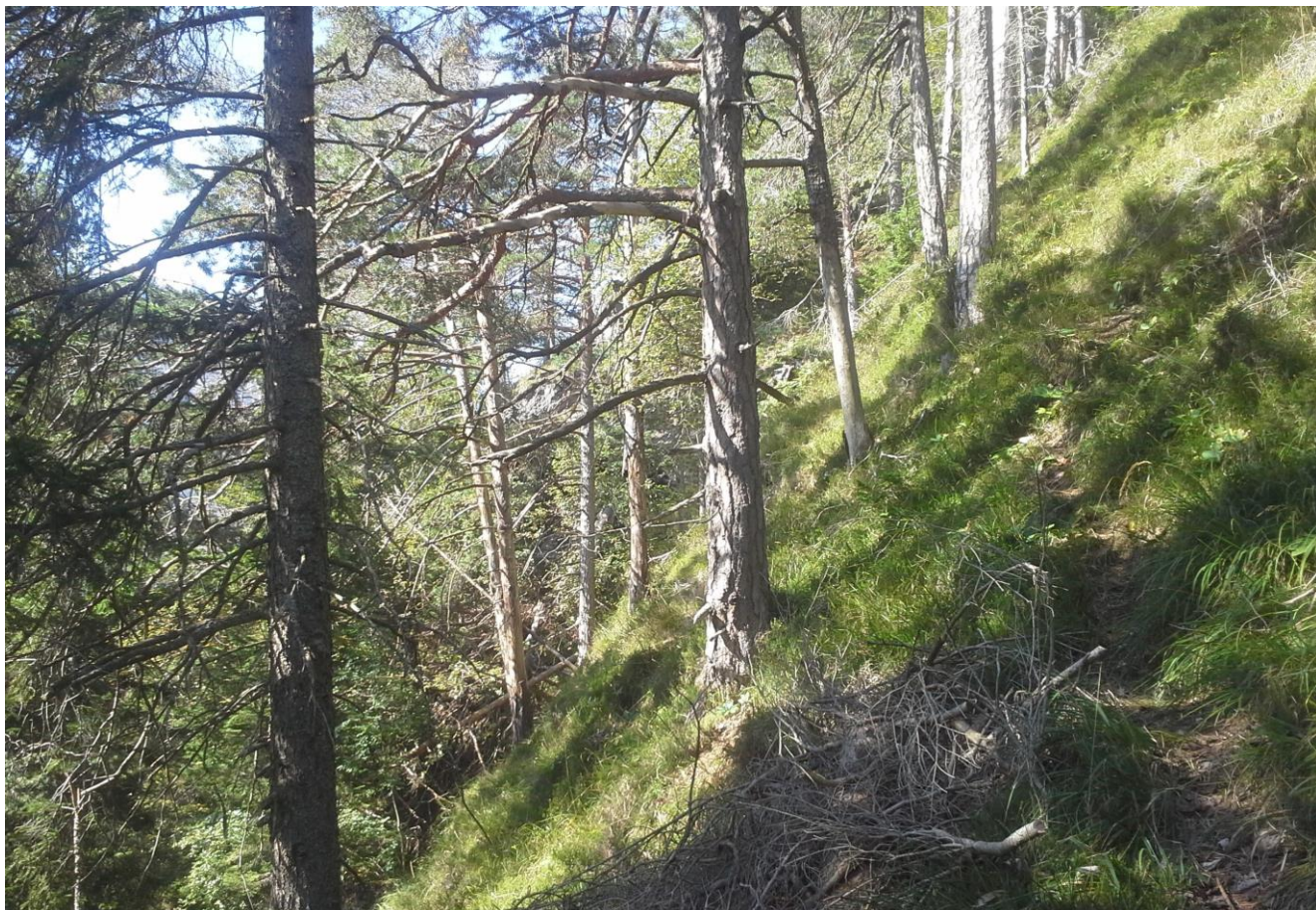
Slika 3: Strm teren porasel z borovim gozdom na trasi nove gozdne ceste na odseku 2