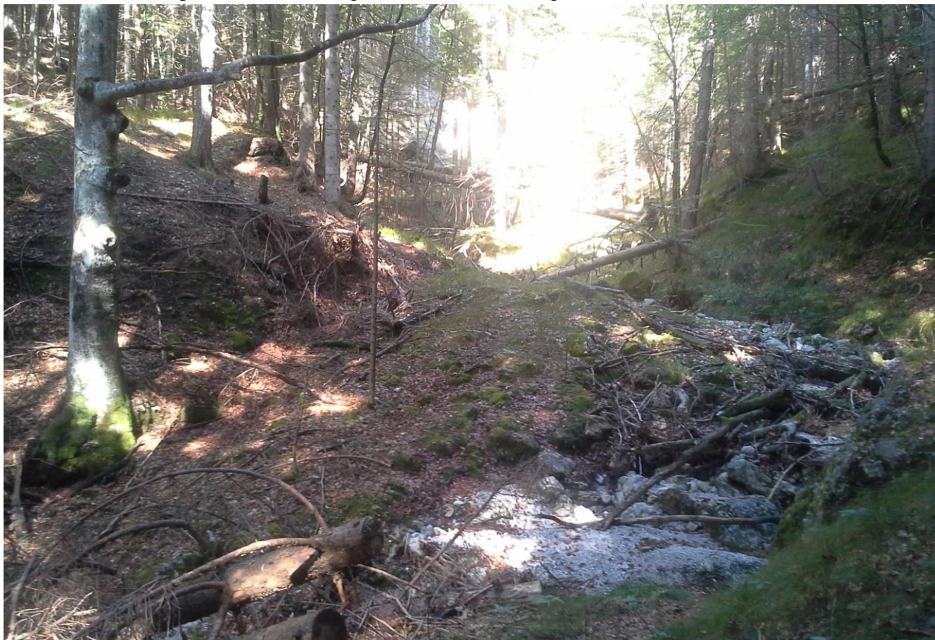
Slika 4: Gorvodni pogled na območje prečkanja hudournika Vršni graben na odseku 3 v km 3,251