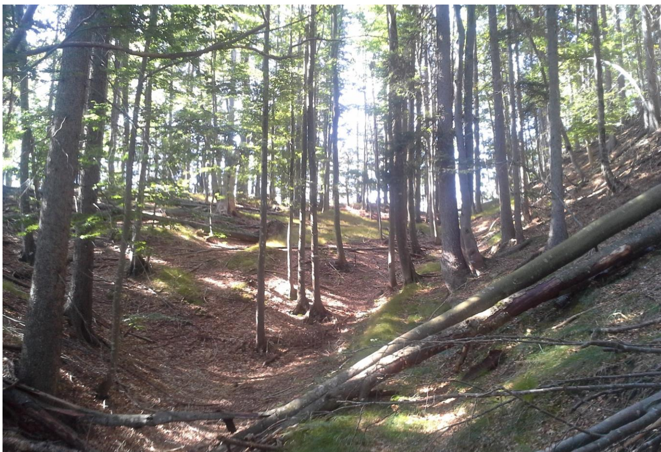
Slika 5: Gorvodni pogled na območje serpentin na točki obrata na Štengah med km 3,800 in km 3,900