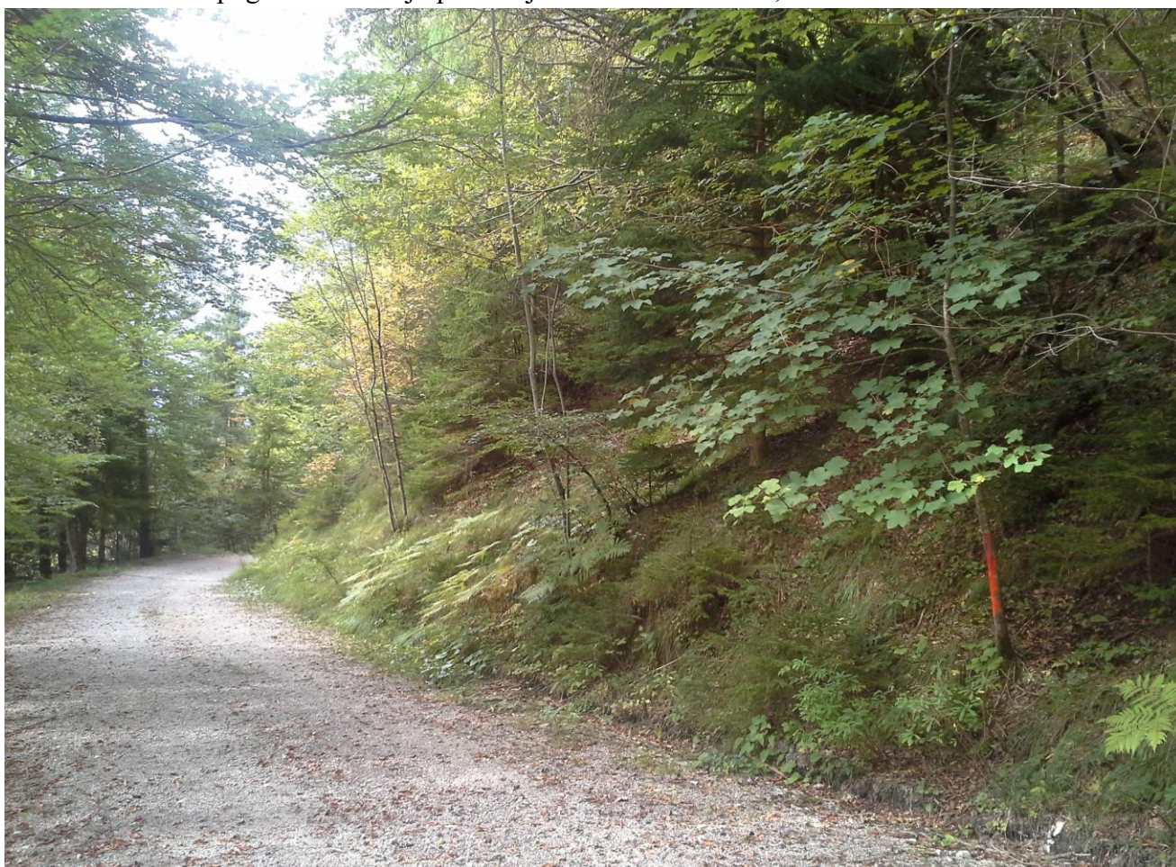
Slika 2: Dolvodni pogled na lokacijo priključka nove ceste na GC 020360 Belca-Jepca v km 2,950