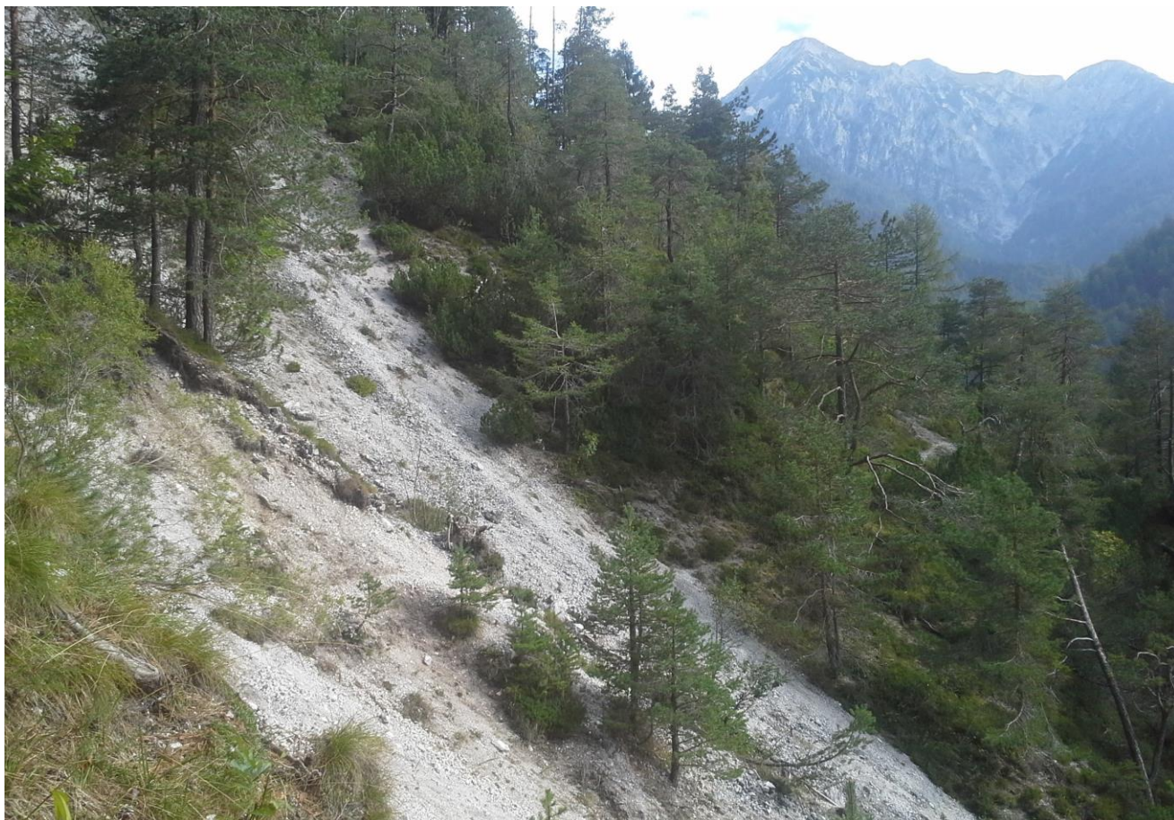
Slika 7: Trasa nove gozdne ceste preko melišča v območju prečkanj med km 4,160 in km 4,240