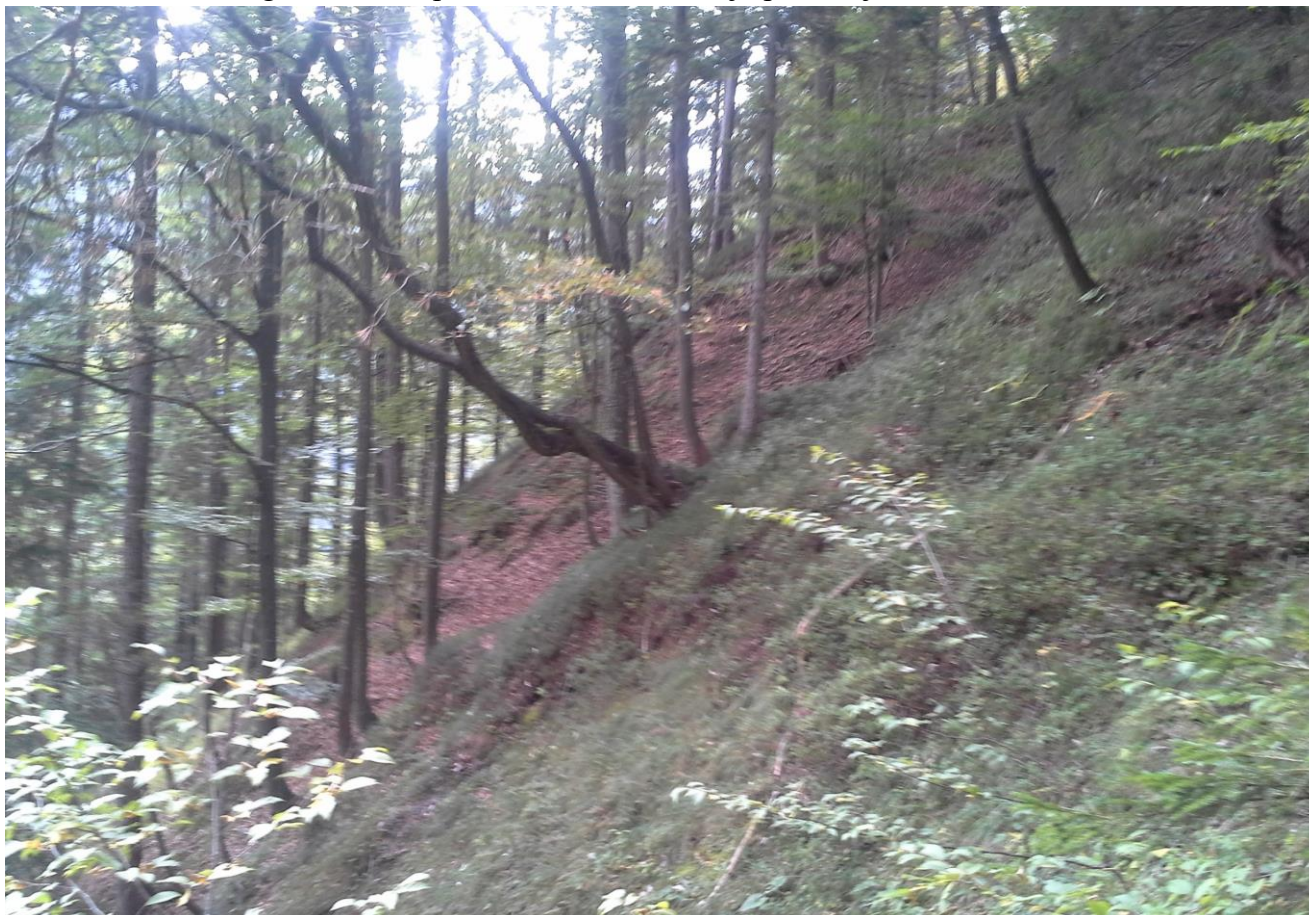
Slika 8: Trasa nove gozdne ceste preko strmega pobočja med km 4,400 in km 4,490