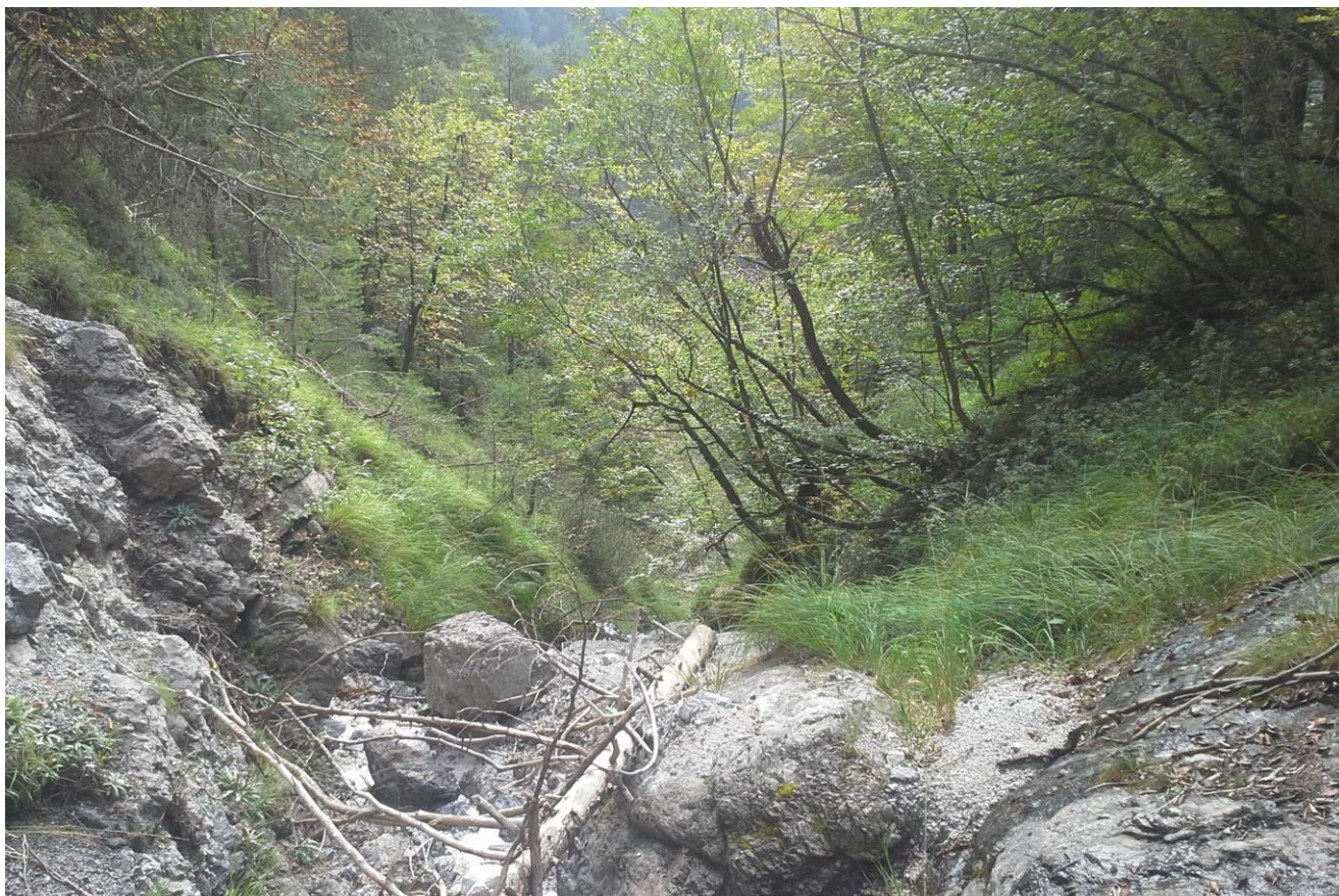
Slika 9: Dolvodni pogled na lokacijo prečkanja hudournika v km 4,499