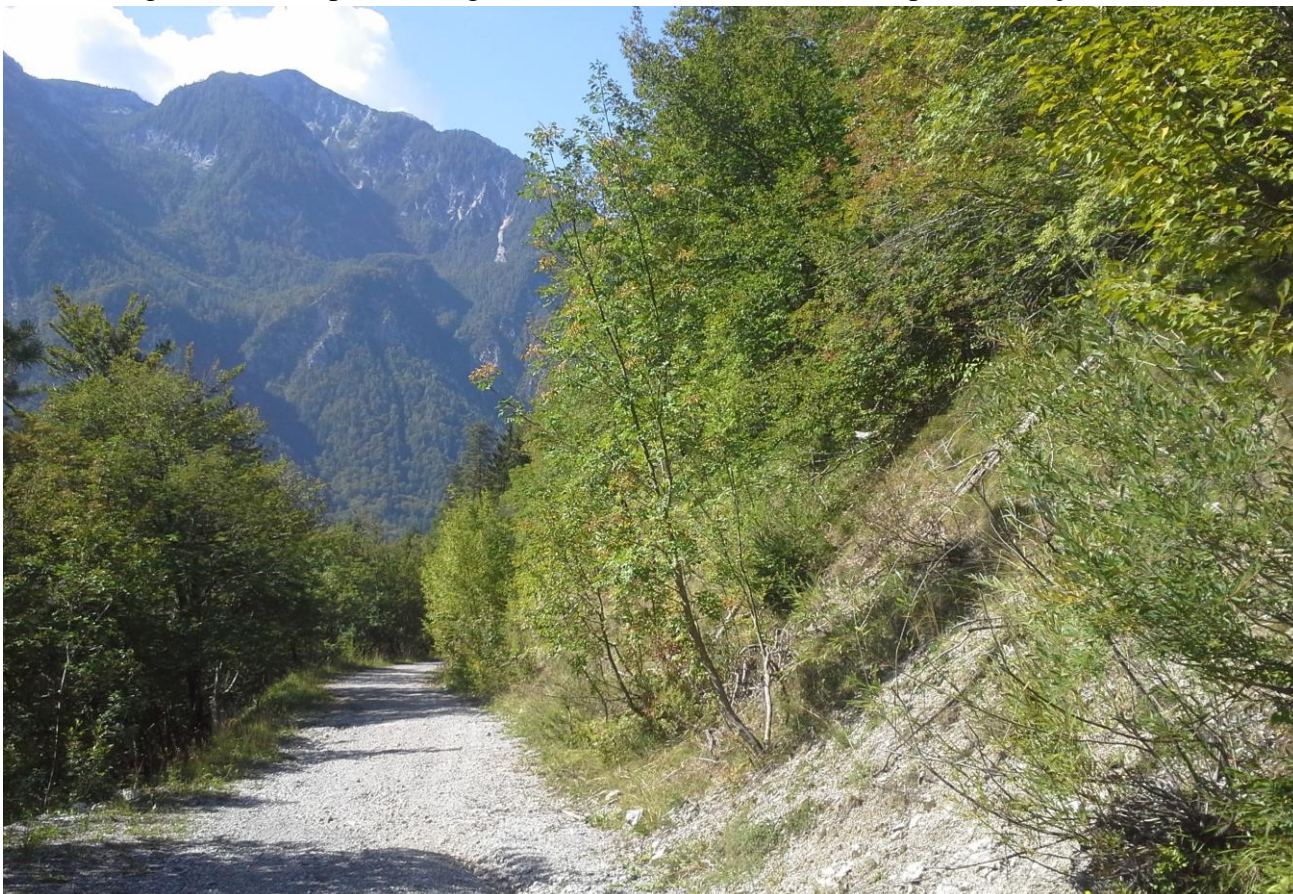
Slika 2: Dolvodni pogled na lokacijo odcepa nove ceste iz GC 020360 Belca-Jepca v km 1,600