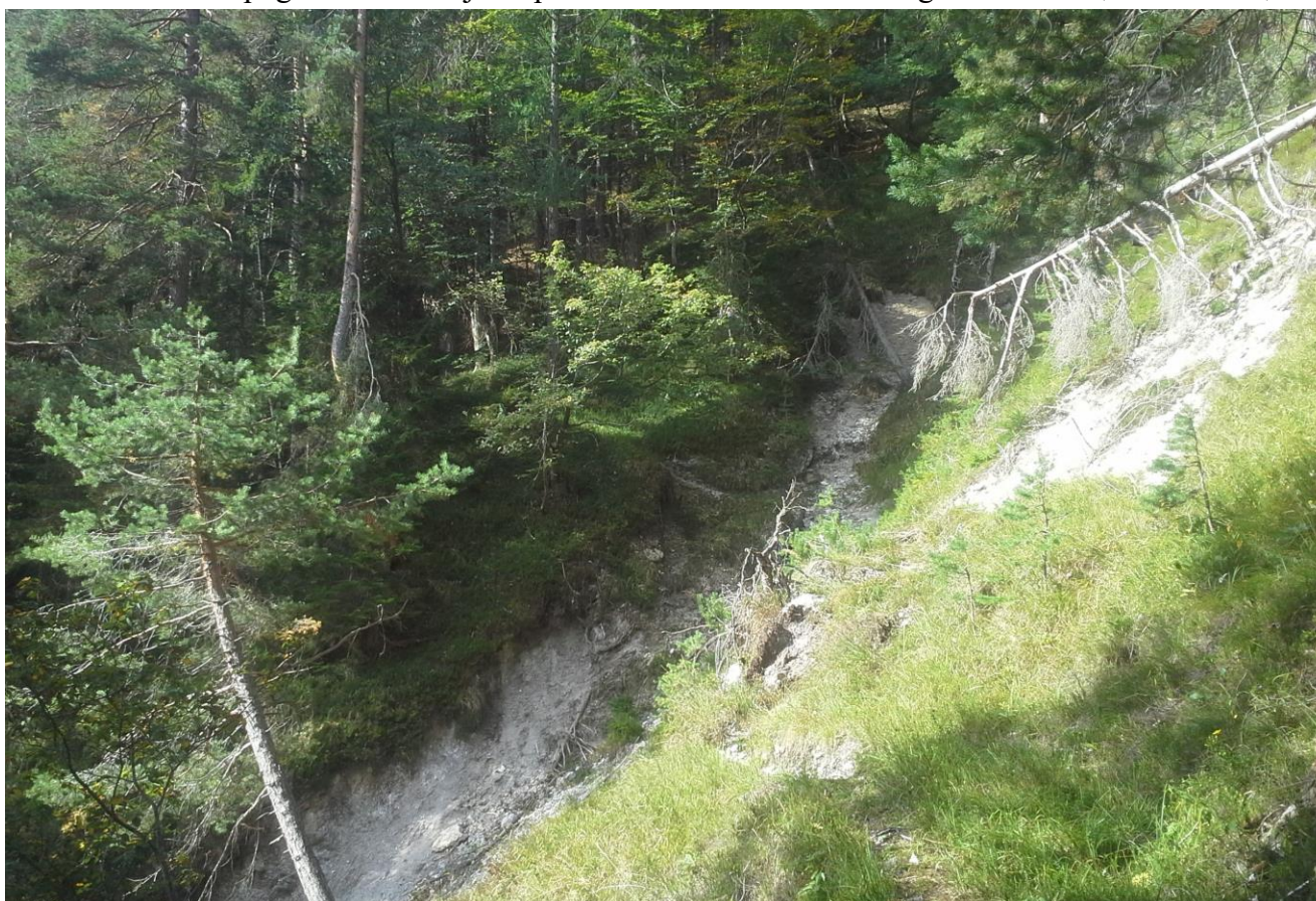
Slika 6: Območje prečkanja ceste čez erodirano strugo hudournika v km 4,025